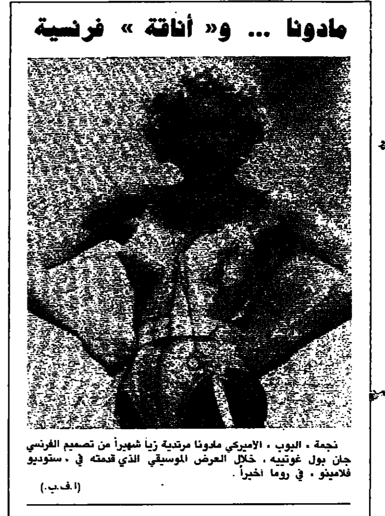
نجمة البوب، الاميركي مادونا مرتدية زياً شهيراً من تصميم الفرنسي جان بول غوتييه، خلال العرض الموسيقي الذي قدمته في ستوديو فلاديمير، في روما اخيراً.

وترتفع اسعار الحملات الاعلانية بشكل خاص بسبب قيام الشركات الكبرى بإطلاق فيلم العام، لديها وقت واحد ابتداء من اواخر حزيران من كل سنة. ويضع هذا الامر بالإحصائيات الى تفصيل الاعلان التلفزيوني. وقد ابتلعت الشاشة الصغيرة ٢٢ مليوناً لثلاث اعلانات ديك تريسي، و ١٧ مليوناً لاعلانات ايام الرعد. وشملت هذه الحملات كالعادة علاقات العجالات والمقالات مع الممثلين والمخرجين والمصان التقنية والبرامج التلفزيونية الخاصة. حتى ان فتالي كل فيلم لم يتربد في كشف الحالة التي وصلت اليها علاقته العاطفية. وانتظر المحصورون ساعات طويلة في نيويورك اخباراً لضبط مادونا ووارن بيتي وهما يتحرجان من احدى غيب الليل. اما توم كروز فتأكدت علاقته مع شريكه كاترين تيرنر في البطولة في ايام الرعد. ويشغل المهنيون حول ما اذا كان هذا التراجع في الاقبال ناجم عن اتجاه عام الى الابتعاد عن السينما، ام عن ظاهرة عابرة عبر عنها الجمهور الاميركي احد اكثر الجماهير العالية ايماناً على السينما، وقبل ديك تريسي، و ايام الرعد، لم تعرف الصالات الاميركية ايضاً انطلاقة قوية حتى مع